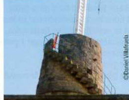
TOUR ROYALE ET SON TÉLÉGRAPHE CHAPPE A GALLARGUES LE MONTUEUX