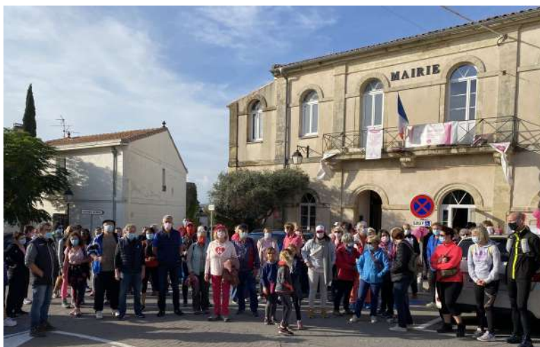
Départ de la marche pour Octobre Rose - dimanche 24 octobre

Nous sommes bien évidemment attristés qu'aucune sortie n'ait pu avoir lieu et que le goûter/animation de la semaine bleue ainsi que le repas de Noël de nos aînés ne puissent être organisés cette année, afin de respecter les règles sanitaires et de préserver la santé de chacun. Mais nous espérons que la fête en sera d'autant plus belle dès que nous pourrons tous nous retrouver !