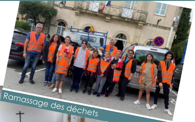
Ramassage des déchets