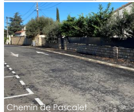
Chemin de Pascalet

Reprise des branchements d'eau potable et d'eaux usées (SIVOM), réfection de la chaussée, création de places de stationnement.