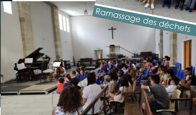
Festival de Musique (avec un moment dédié aux écoliers)