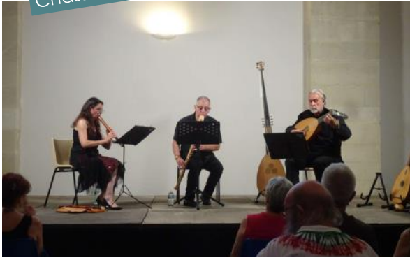
Concert Barocco Trio