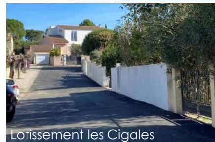
Lotissement les Cigales

Reprise des branchements d'eau potable (SIVOM), réfection de la chaussée.