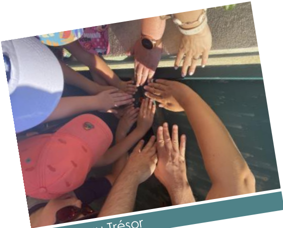
Chasse au Trésor