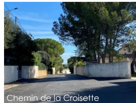
Chemin de la Croisette

Reprise des branchements d'eau potable (SIVOM), réfection de la chaussée, création d'un cheminement piétons et d'un quai pour l'arrêt de bus, nouvel abribus, aménagement paysager grâce au don du Collectif Idéal.