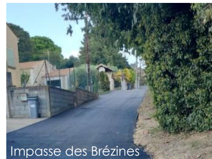
Impasse des Brézines

Réfection de la chaussée et aménagement pour améliorer l'écoulement des eaux pluviales.