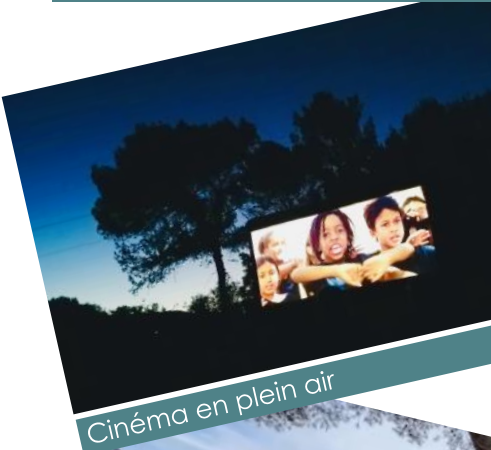
Cinéma en plein air