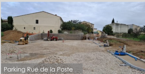
Parking Rue de la Poste

Ces travaux s'inscrivent dans notre volonté constante d'améliorer la qualité de vie dans notre commune. Nous vous remercions pour votre compréhension face aux éventuelles perturbations liées à ces chantiers, qui bénéficient à tous à long terme.