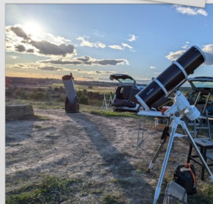
Soirée aux étoiles