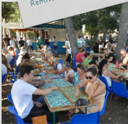
Loto en plein air et repas des villageois