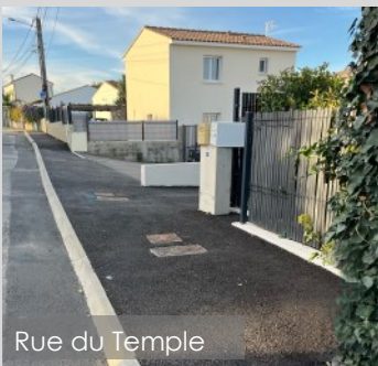
Rue du Temple

Nous poursuivons nos efforts d'amélioration des voiries communales, dont voici les dernières et prochaines réalisations :