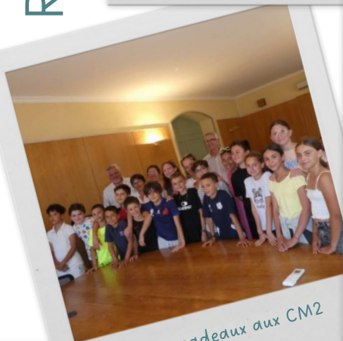
Remise des cadeaux aux CM2