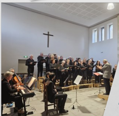
Concert au Temple