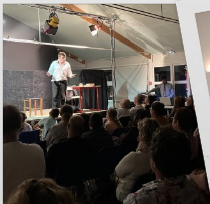
Pièce de théâtre Dyspraxie