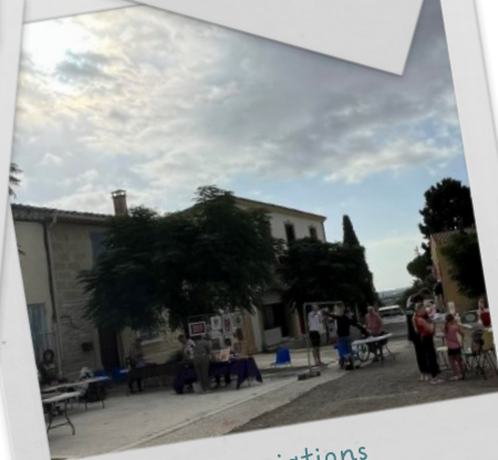
Forum des associations