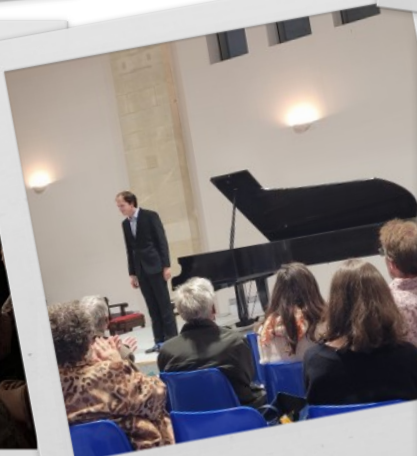
Festival de Piano